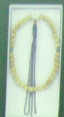
成田山念珠 各 3,000円