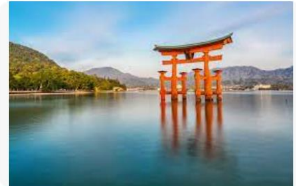
Hotels.com Important Shrines and Temples in Japan ...