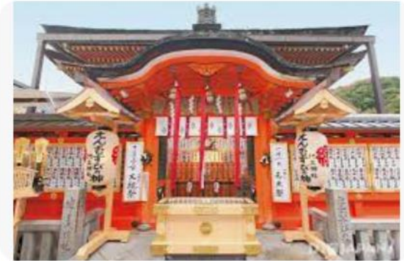
DiGJAPAN! Luck at These Seven Kyoto Shrines ...