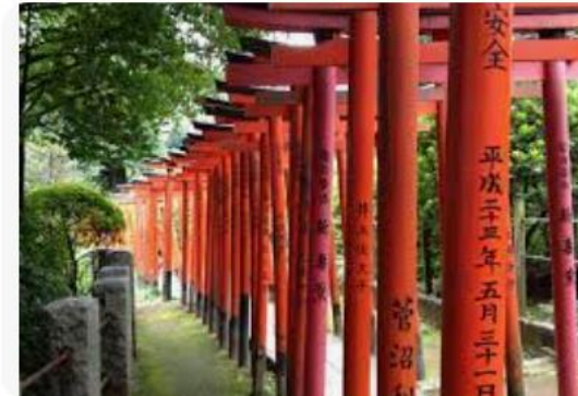
Japan Wonder Travel Blog Tokyo Shrines ...