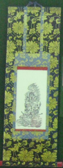
小軸 (原寸大) ※

不動尊掛軸 (特大) 50,000円 (大) 20,000円 (中) 10,000円 (小) 5,000円 ※ 三十六童子掛軸 50,000円