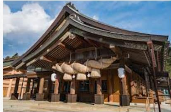
Hotels.com Important Shrines and Temples in Japan ...