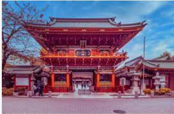
TOKYO TOURISTS 10 most famous shrines from Edo to Tokyo