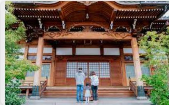
GaijinPot Blog 5 Shrines in Japan to Grant Your Wishes ...