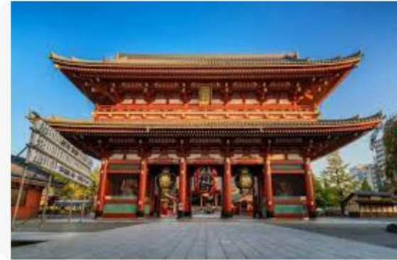
Great Value Vacations 10 Shrines to See While Visiting Japan ...