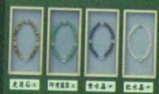
腕輪念珠 (天然石) (不動明王御影入) 各 10,000円