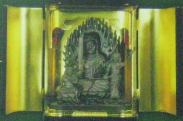
木像厨子入尊像 (原寸大) ※

厨子入尊像 (木像) (大) 150,000円 ※ (中) 120,000円 (小) 50,000円