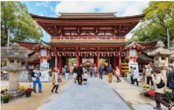
GaijinPot Blog 5 Shrines in Japan to Grant Your Wishes ...