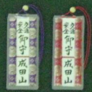
交通安全守(白札) (小) 各 1,000円