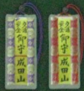
交通安全守(金札) (小) 各 1,000円